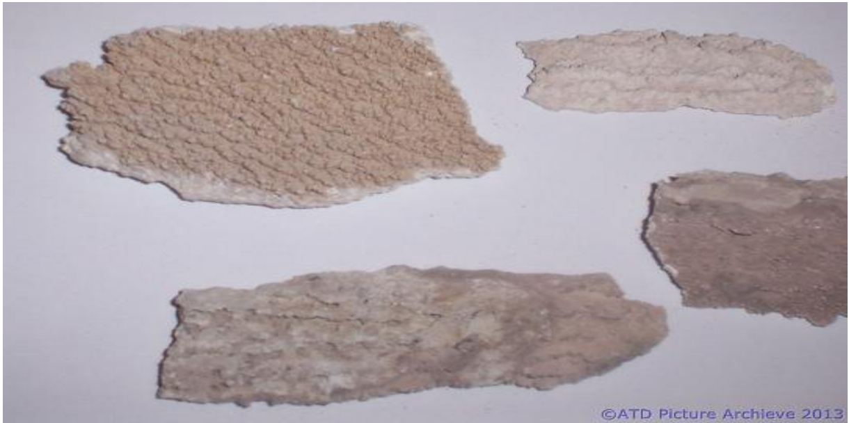
Şekil 2. Değişik tipte birikintiler

Birikinti problemleri; uygulanan inhibitör ve teknik uygulamaların tipine göre (zorlanmış koşulları azaltmak için basınç ayarlamaları, ısı izolasyonları vb) değişim gösterebilir. Sıklıkla karşılaşılan birikintiler akışkanın ani yük kayıplarına uğradığı yani ani genişleme ani daralma gibi noktalarda kendini gösterebilmektedir.