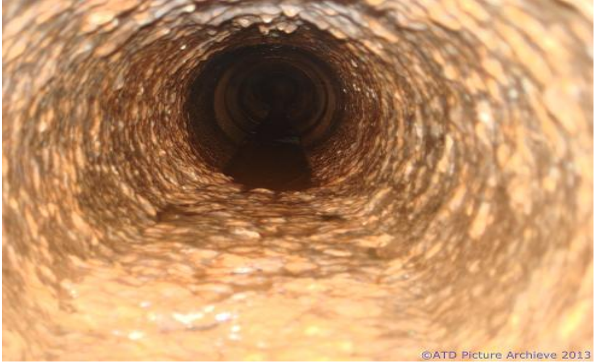
Şekil 5. Soğutma sistemlerinde oluşan bakteri kolonileri ve yarattığı korozif etkiler

Jeotermal enerji santrallerindeki soğutma kulelerinin diğer endüstriyel tesislerdeki kulelerde farkı make up yapılan yani kuleye beslenen suyun genelde santralde konsense olan su olmasıdır. Su oldukça saf olduğundan kışır sorunu yaşanmaz ama gerek jeotermalin doğasından kaynaklanan bazı korozif gazlardan gerekse bakterilerin kolayca üreyebileceği ortamda olmasından dolayı hem korozyon hem de bakteriyel kirlenme öncelikli iki ana sorundur. Bazı bakteri türlerinin korozyon ürünleri ve onlardan oluşan depozitlerde kümelenebildikleri için kışır olmasa da bakteriyel kökenli depozitlenmeler de görülebilir.