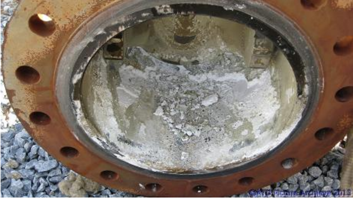
Şekil 6. Ani basınç değişimleri nedeni ile çökeltme yaşanan bir vana sonrası flanş.

Birikinti olsun, korozyon olsun sistemlerde oluşan sorunların doğru yapılamayan işletmecilik ile artması veya oluşması da mümkündür. Örneğin bizzat birikintiyi önlemeye yarayan bir inhibitörün doğru dozajda verilmemesi, aşırı dozajlanması bizzat ürünün kendisinin depozit oluşturmasını yola açabilmektedir.