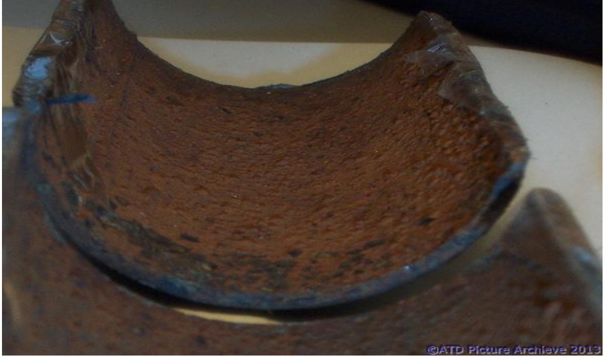
Şekil 4. Karbon çelik malzeme üzerinde ciddi korozyon etkisi.

kaybedilen metal gider ve sistem bir süre sonra ciddi bir problem ile tesisi shut down noktasına getirebilir.