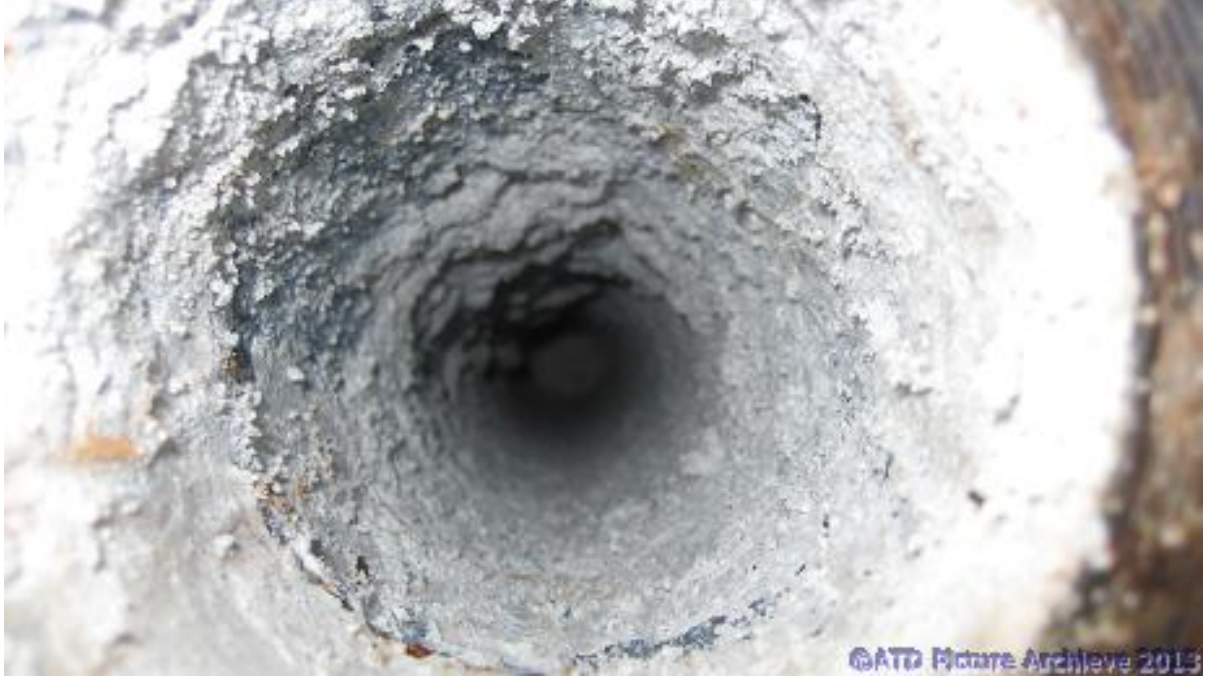
Şekil 1. Tipik bir boru cidarı - \text{CaCO}_3 bazlı - birikintisi

Depozitlenme sorunu sadece kuyu içindeki kesitin daralmasına yol açmaz. Bunun yanında casing ve kapiler boru üzerinde de bir tabaka oluşturacağı için dozaj ekipmanının kuyu içerisinden yukarı çekilmesini engelleyecek, sonucunda kuyu içinde kaybedilmesine kadar gidecek bir sorunlar sinsilesine yol açabilecektir.