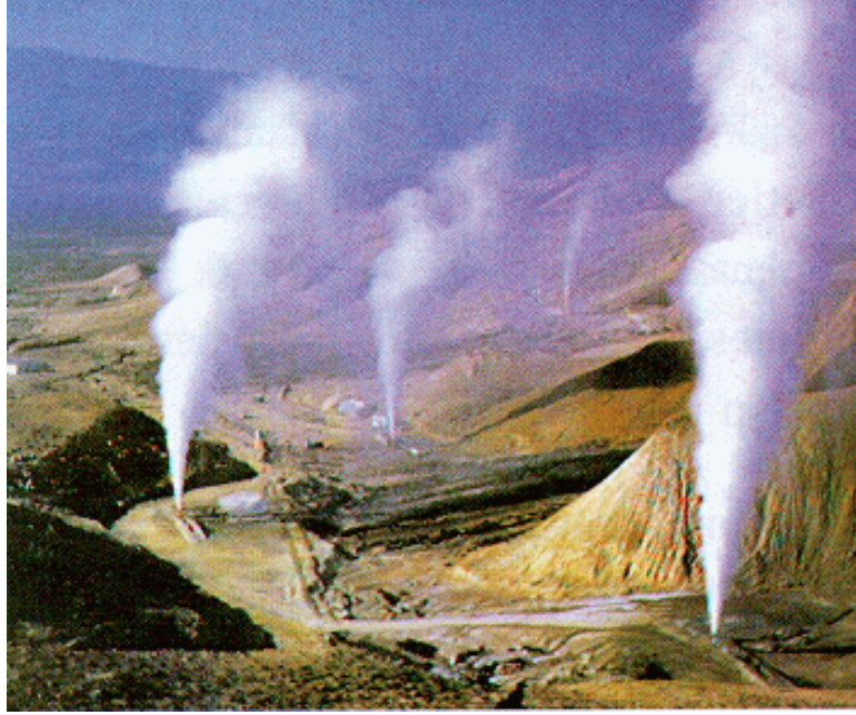
Şekil 1. Jeotermal saha

Bilindiği üzere Türkiye'nin çoğu bölgesinde fay kırıkları mevcuttur. Kırık fayların bulunduğu yerlerde de yıllardan beri sıcak su kaynakları ve kaplıcalar bulunmaktadır. Magmadan kaçan kızgın ve sıvı halde bulunan gazlar yeraltında bulunan çatlak mermer tabakalarını ısıtır. Yağmur suları ve nehirlerden yeraltına inen sular sıcak tabakalarda ısınarak, gazın basınç oluşturması ile jeotermal kaynak olarak yeryüzüne çıkarlar (Şekil 1).